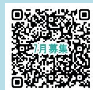
講座募集 QR コード