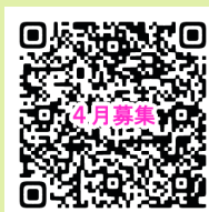
講座募集 QR コード

○ 問い合わせ いわき市生涯学習プラザ ☎0246-37-8888 (電話での申し込みはできません)