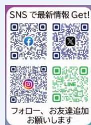
SNSで最新情報 Get! フォロー、お友達追加 お願いします