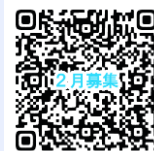
講座申込 QR コード

○ 問い合わせ いわき市生涯学習プラザ ☎0246-37-8888 (電話での申し込みはできません)