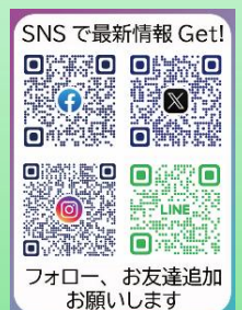
SNS で最新情報 Get! フォロー、お友達追加 お願いします