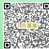
講座申込 QR コード

○ 問い合わせ いわき市生涯学習プラザ ☎0246-37-8888 （電話での申し込みはできません）