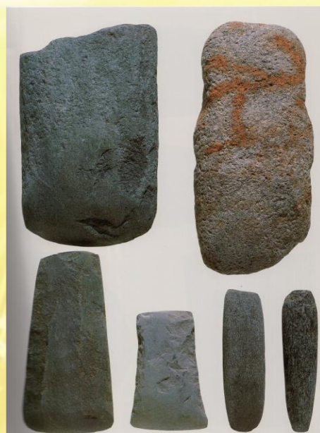
弥生時代石斧（龍門寺遺跡出土）