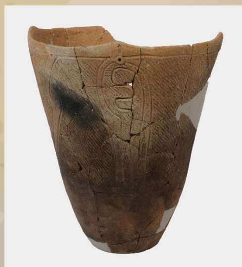
綱取式土器 (岡ノ内遺跡出土)