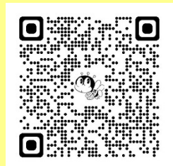
講座申込 QR コード