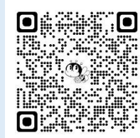
講座申込 QR コード