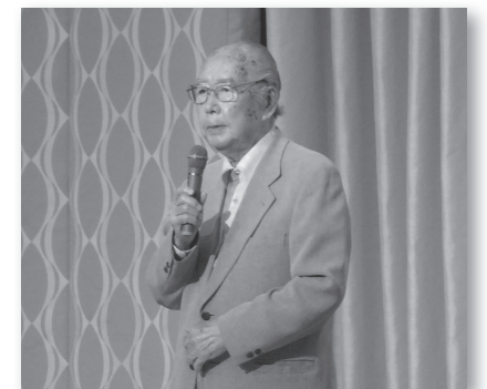
令和元年度 学長講演