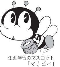
生涯学習のマスコット「マナビ」

いわきヒューマンカレッジ(市民大学)は、市民の皆様の高度で専門的な学習ニーズに応えるために、平成9年度に開学した市民のための大学です。令和5年度は、次の4学部を開講します。興味のある方、学習意欲のある方、ふるってご応募ください。