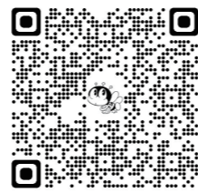
学部申込 QR コード