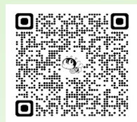
講座申込用QRコード