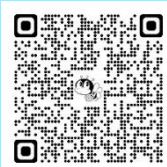
講座申込 QR コード