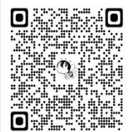
講座申込 QR コード