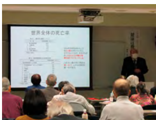
ヘルスサイエンス学部

今年度も、ヘルスサイエンス学部、コミュニティ福祉学部、SDGs 探究学部、いわき学部の4学部が開講され、受講生の方々は講師による説明を熱心に聞き入っていました。残すは令和4年1月に開催予定の修了式となります。