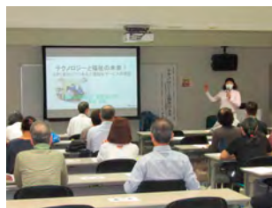
コミュニティ福祉学部