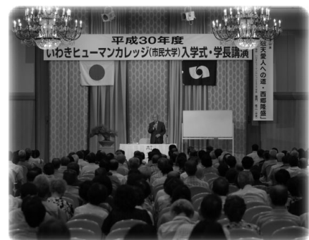
平成30年度入学式 学長講演