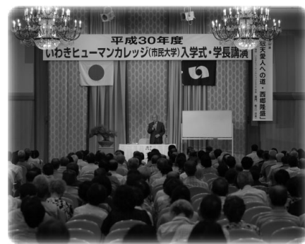
平成30年度入学式 学長講演