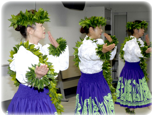
プア・レイによるフラダンス

いわき市生涯学習プラザでは、1月28日(土)・29日(日)に第12回生涯学習フェスティバルを開催いたしました。天候にも恵まれ、3604人の方が来館されました。日頃プラザを中心に活動している49のサークル・団体が、体験や展示・発表、講演会を通して活動の内容や成果を披露し、市民の方と交流を深める事ができました。また、県建設事務所によるいわき市の復旧・進捗状況写真展、生涯学習課による防災サマーカーン体験などの体験学習コーナー